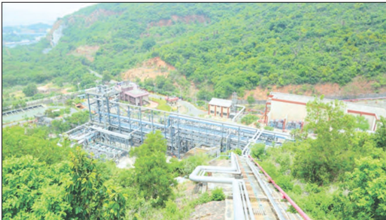
View of the aboveground facilities at Visakhapatnam

The Visakhapatnam Cavern was commissioned in 2015. The facility has two compartments Cavern A (1.03 MMT) and Cavern B (0.3 MMT). Cavern A is for Strategic crude oil and is filled by funds made available by the Government of India. HPCL has taken the cavern B on proportionate cost sharing basis. This is being regularly used by HPCL for its refinery operations at Visakhapatnam. A Joint Ownership agreement was signed with HPCL on 27 th April, 2017.