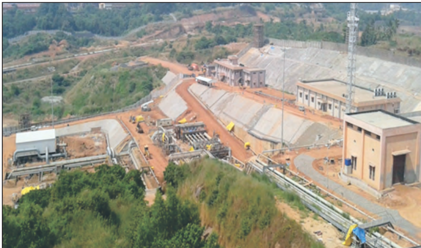
View of the aboveground facilities at Mangalore