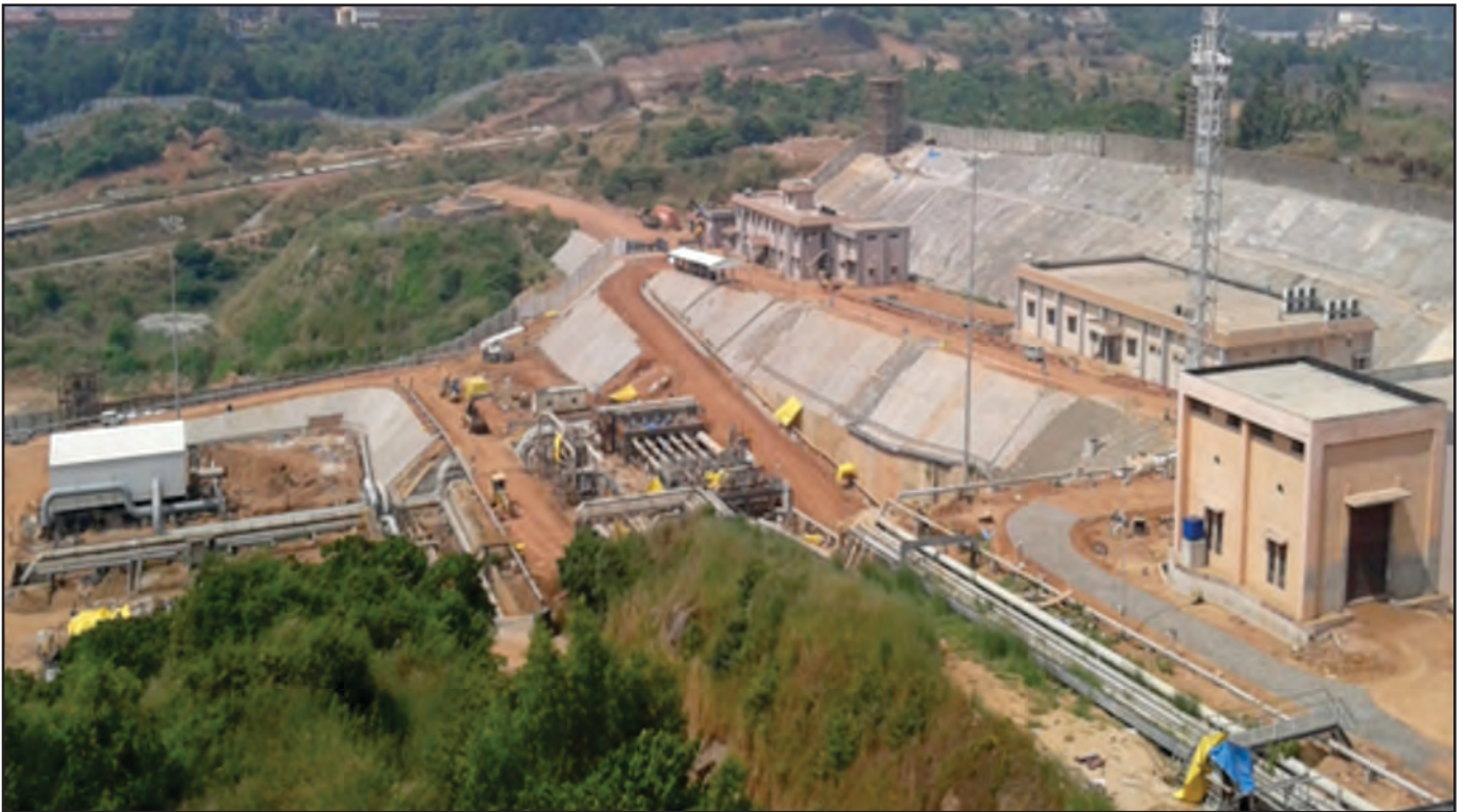
मंगलौर में भूमि के ऊपर बनाई गई सुविधाओं का दृश्य