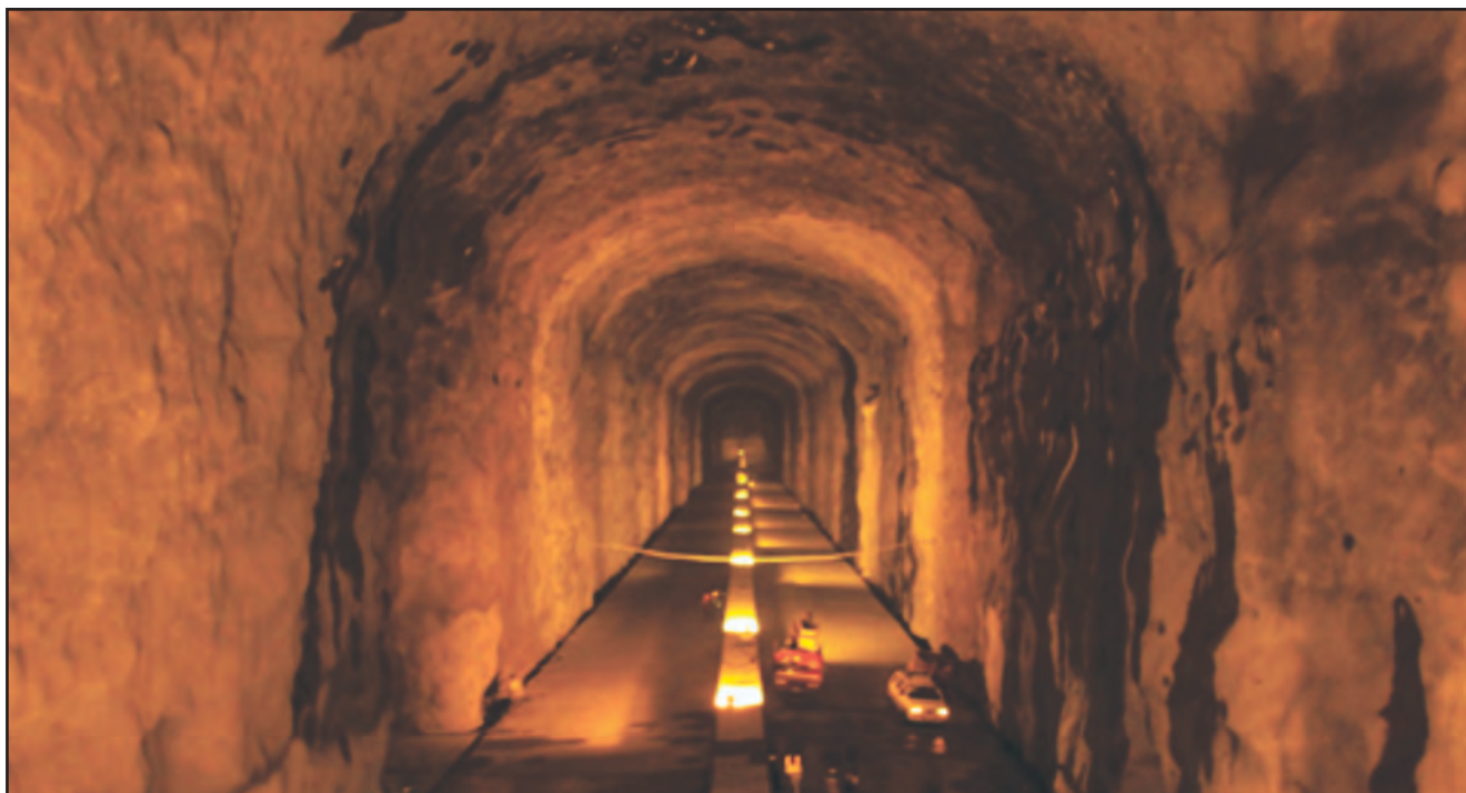
पादुर की कैवर्न