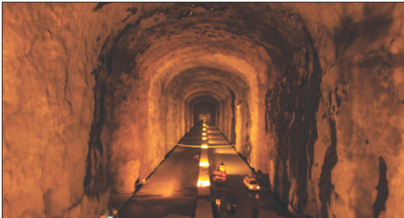
Cavern at Padur